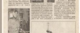
Храм Боговоялениц в селе Боговояленицы.