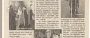
Храм Боговоялениц в селе Боговояленицы.

В статье «БОГУ – БОГОВО, КЕСАРИЮ – КЕСАРЕВО» автор рассуждает о взаимоотношениях между религией и государством. Автор анализирует исторические примеры и современные тенденции.