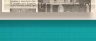
Храм Боговоялениц в селе Боговояленицы.