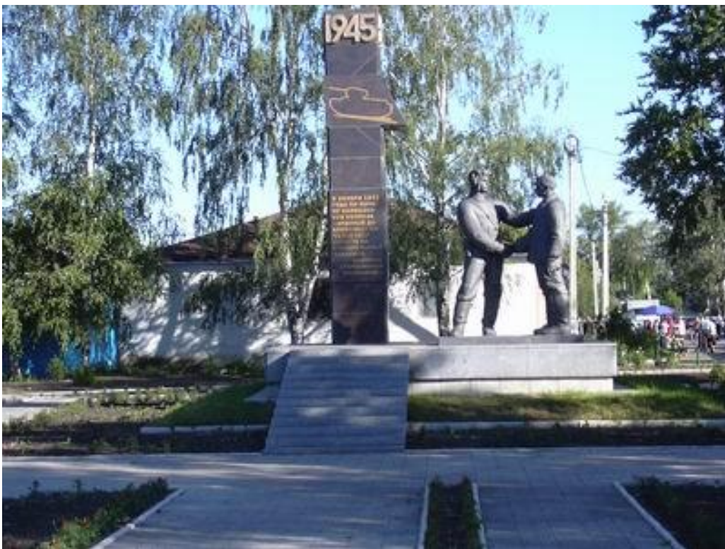
3. Музей истории Петровского района. В здании кинотеатра «Дружба».